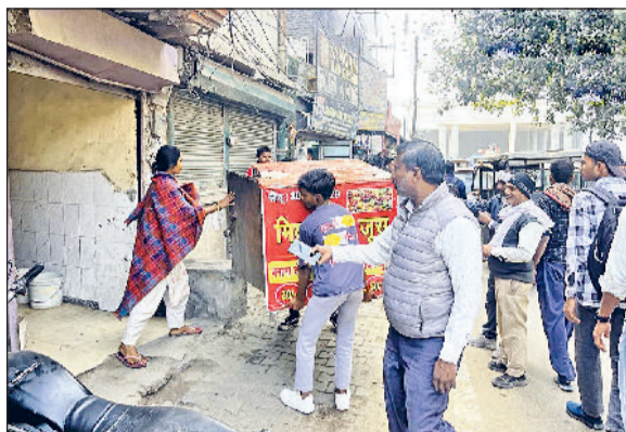
सोनीपत। रेलवे रोड पर अतिक्रमण हटाओ अभियान के दौरान जूय वाले की स्टॉल जब करते नगर निगम कर्मचारी।

नगर निगम ने शहर में बढ़ते अतिक्रमण व यातायात अव्यवस्था को लेकर सख्त रवैया अपनाया शुरू कर दिया है। निगम अधिकारियों व कर्मचारियों ने मंगलवार को मामा भांजा चौक से लेकर रेलवे स्टेशन तक अतिक्रमण हटाओ अभियान चलाया। जिससे दुकानदारों में हड़कंप मचा गया। अभियान के दौरान मुख्य मार्ग मामा भांजा चौक, बस अड्डा रोड, गीता भवन चौक, झंडी चौक, रेलवे रोड पर रेलवे स्टेशन क्षेत्र तक कार्रवाई करते हुए अतिक्रमण करने वाले दुकानदारों व रेहड़ी चालकों का सामान जप्त किया गया। साथ ही दुकानदारों को हिदायत दी गई। नगर निगम की कार्रवाई शुरू होते देख दुकानदारों में हड़कंप मच गया। इस दौरान दुकानदारों ने दुकानों ने बाहर रखे सामान को समेटना शुरू कर दिया। कई दुकानदारों ने फुटपाथ