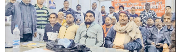
सोनीपत। बैठक के दौरान उपस्थित युनियन के पदाधिकारी एवं सदस्यगण।