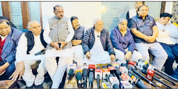
सोनीपत। पत्रकारवार्ता को संबोधित करते हुए भूपेंद्र सिंह हुड्डा साथ में कांग्रेस नेतागण।

पूर्व मुख्यमंत्री और नेता प्रतिपक्ष भूपेंद्र सिंह हुड्डा ने कहा है कि कांग्रेस अपने वाले बजट सत्र नगर निगम चुनाव के लिए पूरी तरह तैयार है। कांग्रेस की नजर बजट पर बनी हुई है। आशंका है कि ये सरकार इस बजट में हरियाणा पर कर्ज का बोझ और बढ़ा सकती है। क्योंकि जब से बीजेपी सत्ता में आई है, हरियाणा की आर्थिक स्थिति दिन-ब-दिन खराब होती गई है। राज्य का कर्ज हरियाणा के गठन से 2014 तक महज 60 हजार करोड़ रुपये था, जो अब बढ़कर 5.25 लाख करोड़ रुपये के आसपास