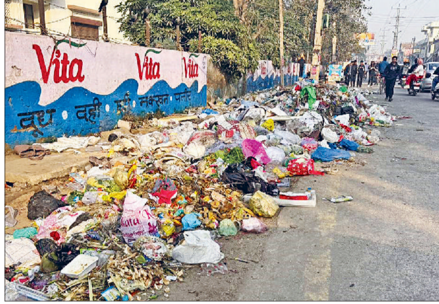
सोनीपत। राठघना रोड स्थित आईटीआई की दीवार के साथ लगा कूड़े का ढेर।

यहां तक कि घरों में से भी कई-कई दिन तक कूड़ा उठान नहीं हो रहा है। इससे न केवल दुर्गंध फैल रही है, बल्कि संक्रमण का खतरा भी बढ़ रहा है।