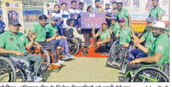
सोनीपत। हरियाणा टीम के विजेता खिलाड़ियों को ट्राफी देते हुए।