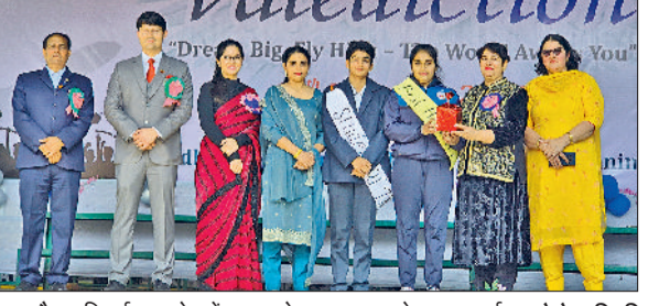
खरखोदा। विदाई समारोह में छात्रा को पुरस्कृत करते हुए प्राचार्या।

माध्यम से विद्यार्थियों ने अपनी प्रतिभा का शानदार प्रदर्शन किया। प्रत्येक प्रस्तुति पर दर्शकों ने तालियों की गड़गड़ाहट से विद्यार्थियों का उत्साहवर्धन किया। फेब्रवैल