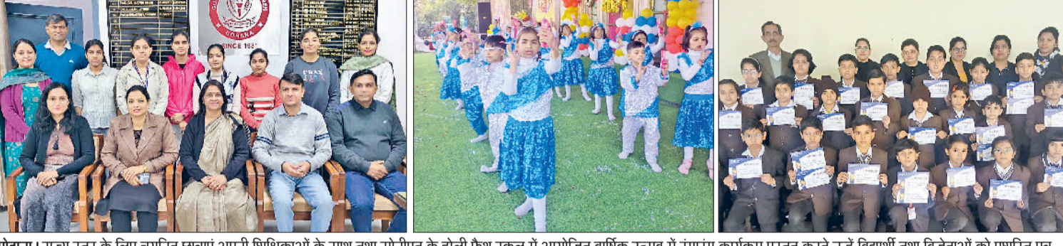
गोहाना। राज्य स्तर के लिए चयनित छात्राएं अपनी शिक्षिकाओं के साथ तथा सोनीपत के होली फैथ स्कूल में आयोजित वार्षिक उत्सव में रंगारंग कार्यक्रम प्रस्तुत करते नन्हें विद्यार्थी तथा विजेताओं को प्रशस्ति पत्र प्रदान करके सम्मानित करते हुए शिक्षिकाएं।