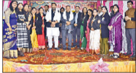
सोनीपत। कार्यक्रम में पहुंचे विधायक, पूर्व मेयर साथ में विद्यालय स्टाफ।