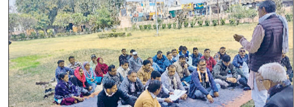
सोनीपत। बैठक के दौरान उपस्थित संघ के पदाधिकारी एवं सदस्यगण।