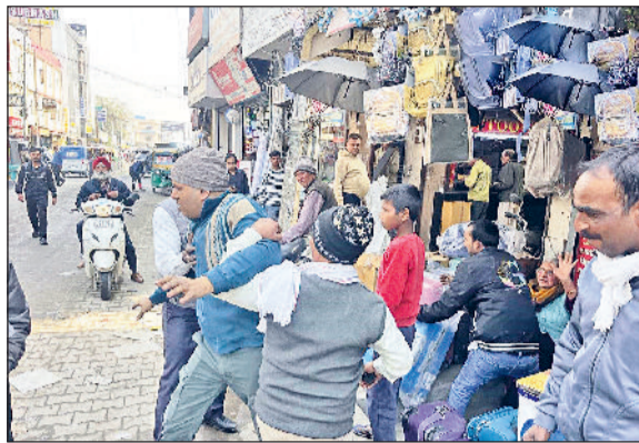
सोनीपत। मामा भांजा चौक स्थित दुकान पर कार्रवाई से रोकते दुकानदारों को पकड़ते व सामान उठाते निगम कर्मचारी।

व सड़क किनारे अपना सामान सजा रखा था, इससे राहगीरों को आवागमन में भारी परेशानी का सामना करना पड़ रहा था। साथ ही दिनभर कई बार जाम की स्थिति बनी रहती है। ऐसे में निगम टीम ने मौके पर कर्मचारियों की मदद से अतिक्रमण हटवाया, सड़क व फुटपाथ को खाली कराया। वहीं सामान जप्त किए जाने के बाद कई दुकानदार भावुक नजर आए, लेकिन निगम कर्मचारियों ने उनका सामान जप्त करना जारी रखा। निगम टीम के साथ पुलिस बल होने के चलते दुकानदारों की एक न चली।