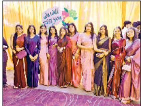
सोनीपत। हिंदू विद्यापीठ में आयोजित कार्यक्रम के दौरान उपस्थित छात्राएं।